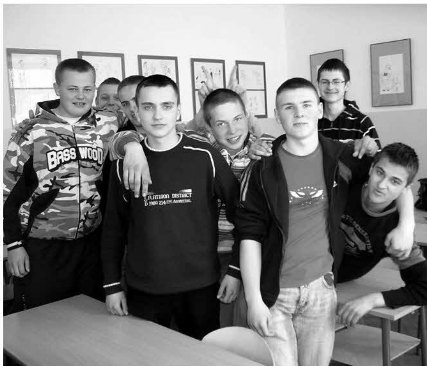
I a t w osłabionym składzie! Ciekawe, gdzie reszta! Na pewno w bibliotece...

W jej stroju pełno było dziur, przez które było widać sytuację społeczną