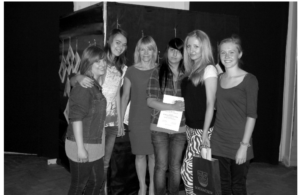
Redakcja Cichacza2 podczas wręczania nagród XV Konkursu Młodych Dziennikarzy