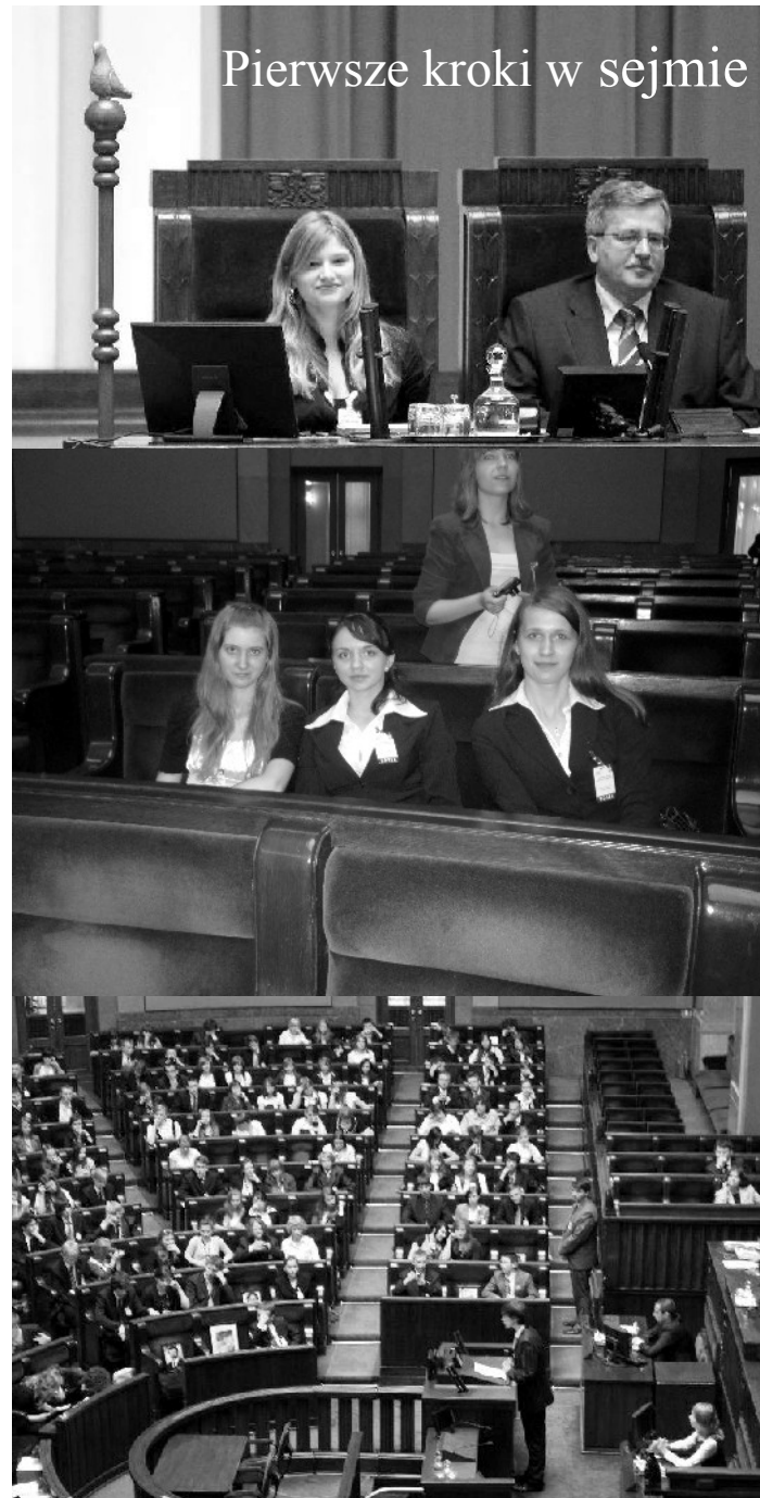
Pierwsze kroki w sejmie