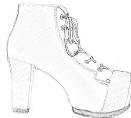
Rys. Agata Nowakowska